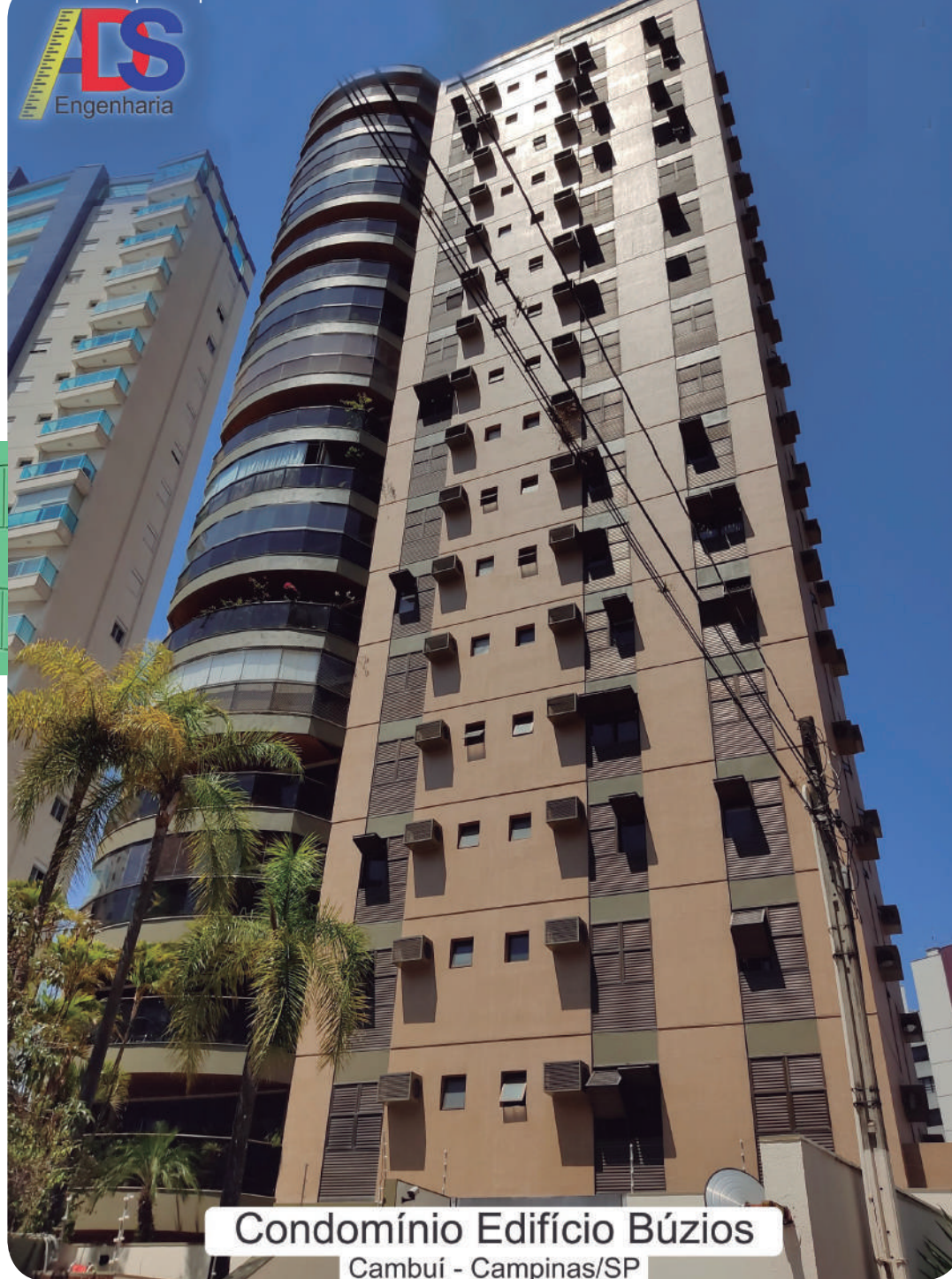
Condomínio Edifício Búzios