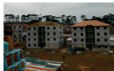
Obras telhados Const. Dória 8.300m 2