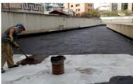
Impermeabilização área de 1.500m 2

- Há mais de 25 anos no mercado - Equipe treinada e habilitada para TRABALHOS EM ALTURA