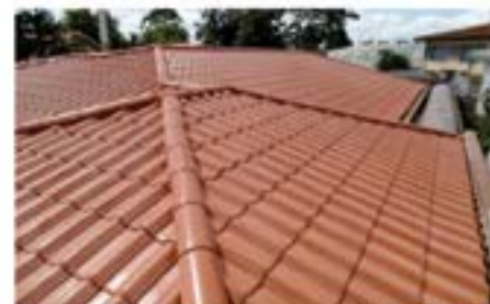
Cobertura conjunto residencial

Construção | Reforma | Estruturas de Madeira ou Metálica