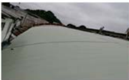
Telhado Mercado Municipal 3.000m 2